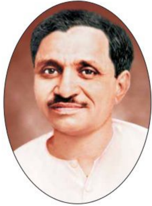
पं. दीनदयाल उपाध्याय