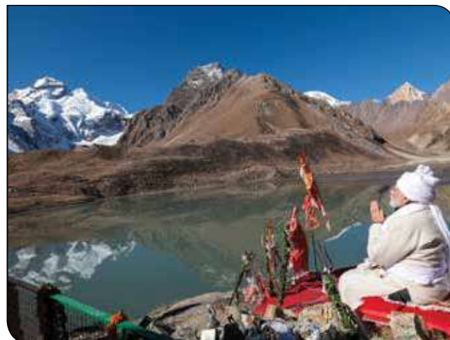
पिथौरागढ़ (उत्तराखंड) में 12 अक्टूबर, 2023 को पार्वती कुंड पर पूजा और दर्शन करते प्रधानमंत्री श्री नरेन्द्र मोदी