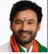
जी किशन रेड्डी

जै से ही ऐतिहासिक नारी शक्ति वंदन अधिनियम संसद में प्रस्तुत किया गया, प्रधानमंत्री श्री नरेन्द्र मोदी ने इसके पारित होने को सांसदों के लिए अग्निपरीक्षा की संज्ञा कहकर संबोधित किया। यह अग्निपरीक्षा वास्तव में थी— भारत के पारंपरिक गौरव को बहाल करने के लिए अग्निपरीक्षा, जो समानता और संतुलन के साथ खड़ी थी; अग्निपरीक्षा उस सर्वोच्च स्थान को पुनः प्राप्त करने के लिए जिसका लाभ प्राचीन काल से महिलाओं को मिलता आया है; और राजनीतिक बाध्यताओं से ऊपर उठकर नारी शक्ति के लिए एक साथ खड़े होने के लिए अग्नि परीक्षा थी। संसद, जिसे लोकतंत्र का मंदिर कहा जाता है, को अर्धनारीश्वर की भावना का प्रतीक होना चाहिए और इसे नारी शक्ति द्वारा लाई गई समानता और पूर्ण संतुलन का प्रतीक होना चाहिए।