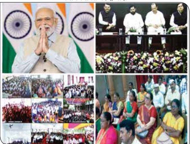
महाराष्ट्र में 19 अक्टूबर, 2023 को 'प्रमोद महाजन ग्रामीण कौशल्य विकास केंद्र' के शुभारंभ पर लोगों को संबोधित करते प्रधानमंत्री श्री नरेन्द्र मोदी