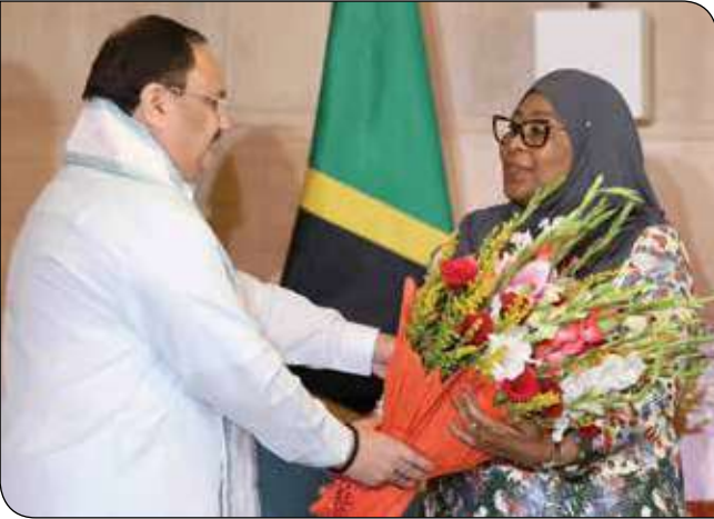
नई दिल्ली में 11 अक्टूबर, 2023 को तंजानिया की राष्ट्रपति सुश्री सामिया सुलुहू हसन से मुलाकात करते भाजपा राष्ट्रीय अध्यक्ष श्री जगत प्रकाश नड्डा