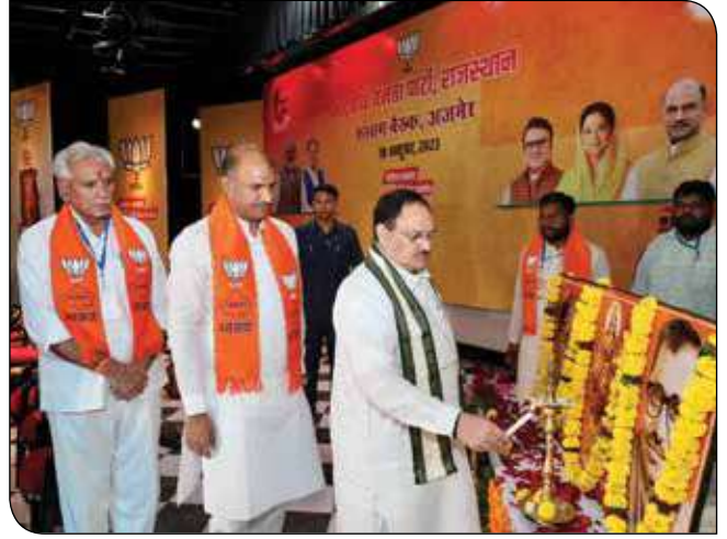
अजमेर (राजस्थान) में 18 अक्टूबर, 2023 को भाजपा संभाग बैठक के दौरान भाजपा राष्ट्रीय अध्यक्ष श्री जगत प्रकाश नड्डा