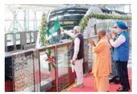
प्रधानमंत्री ने 'नमो भारत' रैपिडएक्स ट्रेन को दिखाई हरी झंडी