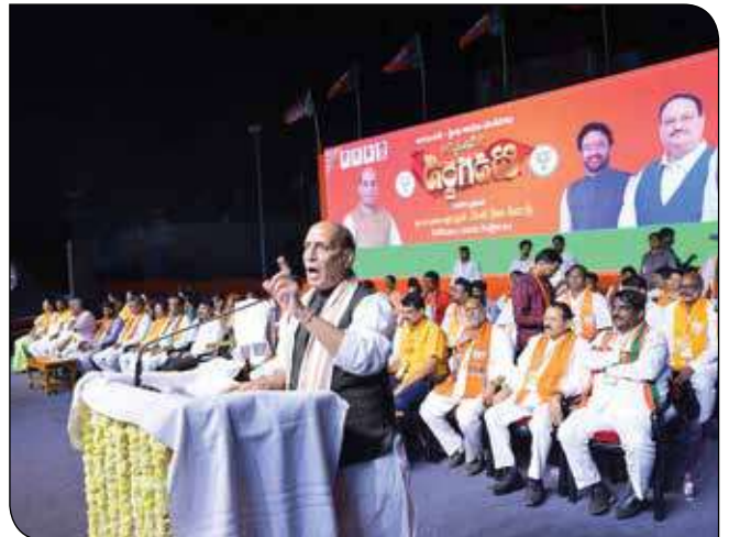
हुजुराबाद विधानसभा क्षेत्रों (तेलंगाना) में 16 अक्टूबर, 2023 को एक विशाल चुनावी सभा को संबोधित करते रक्षा मंत्री श्री राजनाथ सिंह