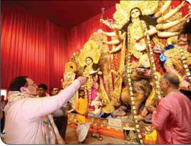
कोलकाता (पश्चिम बंगाल) में 21 अक्टूबर, 2023 को दुर्गा पूजा उत्सव के दौरान महासप्तमी के अवसर पर विभिन्न पूजा पंडालों का दर्शन कर पूजा-अर्चना करते भाजपा राष्ट्रीय अध्यक्ष श्री जगत प्रकाश नड्डा