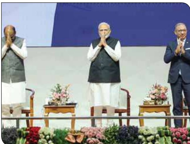
यशोभूमि (नई दिल्ली) में 13 अक्टूबर, 2023 को 9वें जी20 संसदीय अध्यक्ष शिखर सम्मेलन (पी20) के उद्घाटन के दौरान प्रधानमंत्री श्री नरेन्द्र मोदी