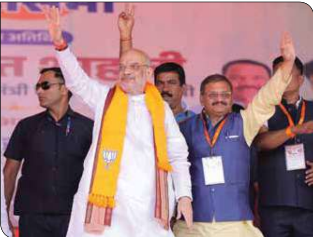
जगदलपुर (छत्तीसगढ़) में 19 अक्टूबर, 2023 को 'परिवर्तन संकल्प रैली' के दौरान अभिवादन स्वीकार करते केंद्रीय गृह एवं सहकारिता मंत्री श्री अमित शाह