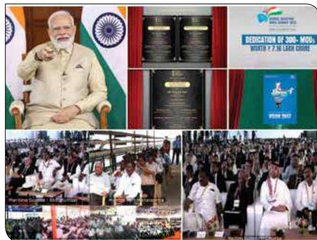
17 अक्टूबर, 2023 को ग्लोबल मैरीटाइम इंडिया समिट (जीएमआईएस) 2023 के तीसरे संस्करण का उद्घाटन करते प्रधानमंत्री श्री नरेन्द्र मोदी