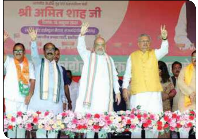
राजनांदगांव (छत्तीसगढ़) में 16 अक्टूबर, 2023 को 'परिवर्तन संकल्प रैली' के दौरान लोगों का अभिवादन स्वीकार करते केंद्रीय गृह एवं सहकारिता मंत्री श्री अमित शाह