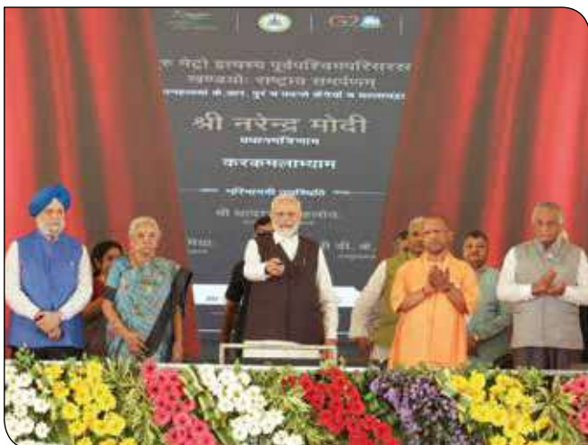
20 अक्टूबर, 2023 को उत्तर प्रदेश के साहिबाबाद से दुहाई डिपो के बीच चलने वाली रैपिडएक्स ट्रेन 'नमो भारत' को हरी झंडी दिखाते और स्कूली बच्चों एवं रैपिडएक्स ट्रेन के चालक दल के साथ बातचीत करते प्रधानमंत्री श्री नरेन्द्र मोदी