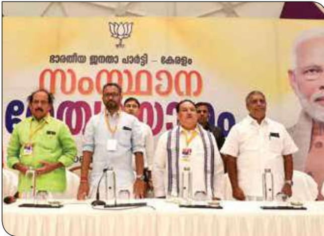
तिरुवनंतपुरम (केरल) में 30 अक्टूबर, 2023 को भाजपा प्रदेश नेतृत्व बैठक को संबोधित करते भाजपा राष्ट्रीय अध्यक्ष श्री जगत प्रकाश नड्डा