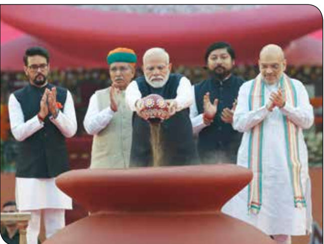
कर्तव्य पथ (नई दिल्ली) में 31 अक्टूबर, 2023 को 'मेरी माटी मेरा देश अभियान' के तहत अमृत कलश यात्रा समापन के अवसर पर आयोजित कार्यक्रम के दौरान प्रधानमंत्री श्री नरेन्द्र मोदी