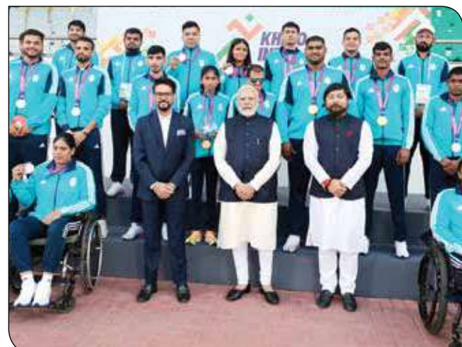
मेजर ध्यानचंद नेशनल स्टेडियम (नई दिल्ली) में 01 नवंबर, 2023 को एशियाई पैरा खेलों के लिए भारतीय दल के साथ एक समूह चित्र में प्रधानमंत्री श्री नरेन्द्र मोदी