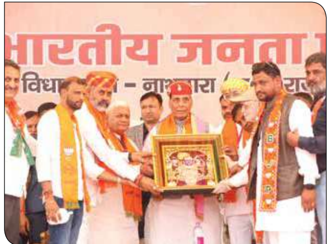
नाथद्वारा में 03 नवंबर, 2023 को एक विशाल चुनावी रैली के दौरान रक्षा मंत्री श्री राजनाथ सिंह का स्वागत करते राजस्थान भाजपा के पदाधिकारीगण