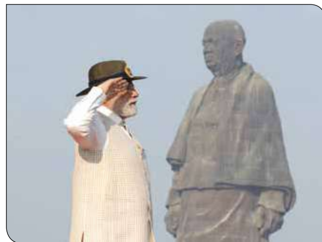
केवडिया (गुजरात) में 31 अक्टूबर, 2023 राष्ट्रीय एकता दिवस परेड में सम्मिलित होते प्रधानमंत्री श्री नरेन्द्र मोदी