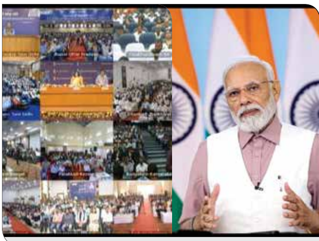
नई दिल्ली से 28 अक्टूबर, 2023 को राष्ट्रीय रोजगार मेले को संबोधित करते प्रधानमंत्री श्री नरेन्द्र मोदी