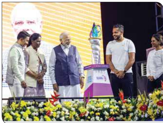
मडगांव (गोवा) में 26 अक्टूबर, 2023 को पंडित जवाहरलाल नेहरू स्टेडियम में 37वें राष्ट्रीय खेलों का उद्घाटन करते प्रधानमंत्री श्री नरेन्द्र मोदी