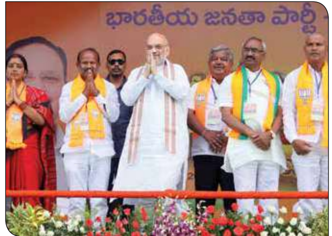
सूर्यपिट (तेलंगाना) में 27 अक्टूबर, 2023 को 'जन गर्जना रैली' में जनाभिवादन स्वीकार करते केंद्रीय गृह एवं सहकारिता मंत्री श्री अमित शाह