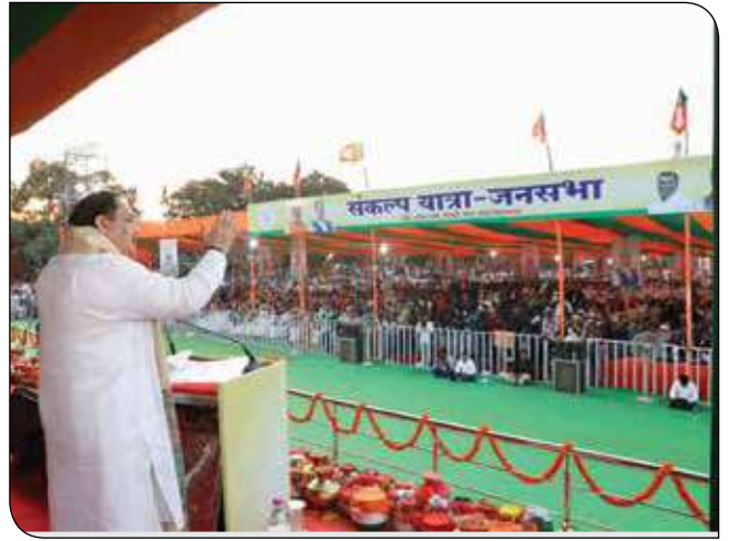
रांची (झारखंड) में 28 अक्टूबर, 2023 को 'संकल्प यात्रा समर्पण समारोह' को संबोधित करते भाजपा राष्ट्रीय अध्यक्ष श्री जगत प्रकाश नड्डा