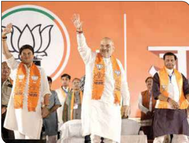
ग्वालियर (मध्य प्रदेश) में 04 नवंबर, 2023 को एक विशाल जनसभा में जनाभिवादन स्वीकार करते केंद्रीय गृह एवं सहकारिता मंत्री श्री अमित शाह