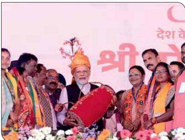
सीधी (मध्य प्रदेश) में 07 नवंबर, 2023 को एक विशाल जनसभा के दौरान प्रधानमंत्री श्री नरेन्द्र मोदी