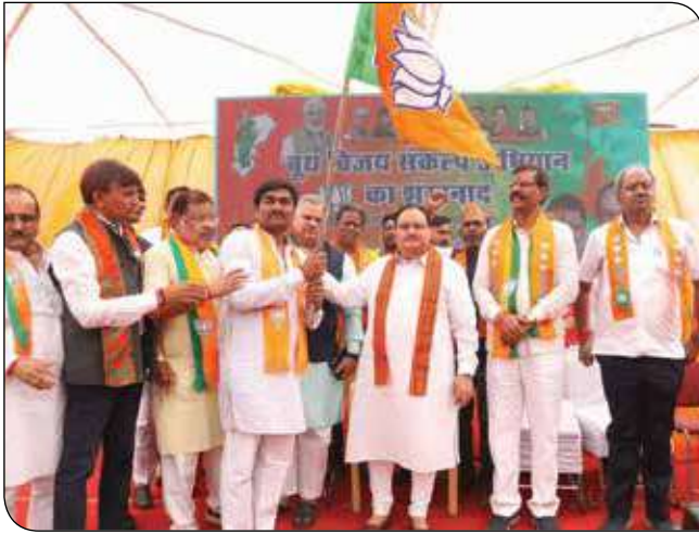
वार्ड नंबर 52, रायपुर (छत्तीसगढ़) में 29 अक्टूबर, 2023 को 'बूथ संकल्प अभियान' के शुभारंभ अवसर पर भाजपा राष्ट्रीय अध्यक्ष श्री जगत प्रकाश नड्डा