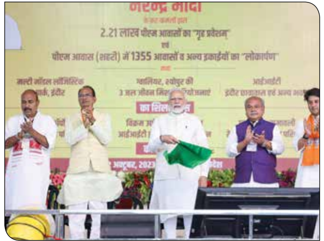
मध्य प्रदेश में 02 अक्टूबर, 2023 को ग्वालियर और सुमावली के बीच चलने वाली ट्रेन को हरी झंडी दिखाते और विभिन्न परियोजनाओं को राष्ट्र को समर्पित करते प्रधानमंत्री श्री नरेन्द्र मोदी