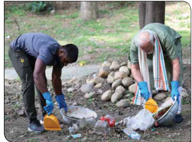
नई दिल्ली में 01 अक्टूबर, 2023 को राष्ट्रपिता महात्मा गांधी की स्मृति में 'स्वच्छता ही सेवा' अभियान में भाग लेते प्रधानमंत्री श्री नरेन्द्र मोदी