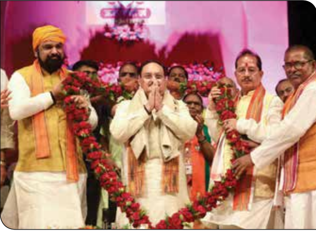
पटना में 05 अक्टूबर, 2023 को बिहार प्रदेश भाजपा ने श्रद्धेय कैलाशपति मिश्रजी के जन्मशताब्दी समारोह में भाजपा राष्ट्रीय अध्यक्ष श्री जगत प्रकाश नड्डा का स्वागत किया