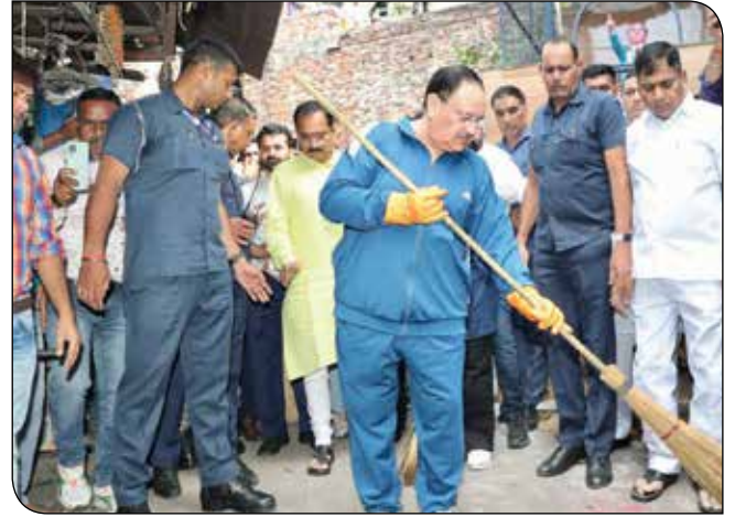
नई दिल्ली में 01 अक्टूबर, 2023 को 'स्वच्छता ही सेवा' अभियान में सम्मिलित होते भाजपा राष्ट्रीय अध्यक्ष श्री जगत प्रकाश नड्डा