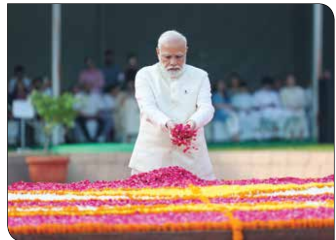
नई दिल्ली में 02 अक्टूबर, 2023 को विजय घाट पर पूर्व प्रधानमंत्री श्री लाल बहादुर शास्त्री की जयंती पर उनकी समाधि पर पुष्पांजलि अर्पित करते प्रधानमंत्री श्री नरेन्द्र मोदी