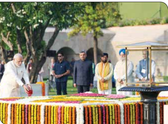
नई दिल्ली में 02 अक्टूबर, 2023 को गांधी जयंती पर राजघाट में महात्मा गांधी की समाधि पर पुष्पांजलि अर्पित करते प्रधानमंत्री श्री नरेन्द्र मोदी