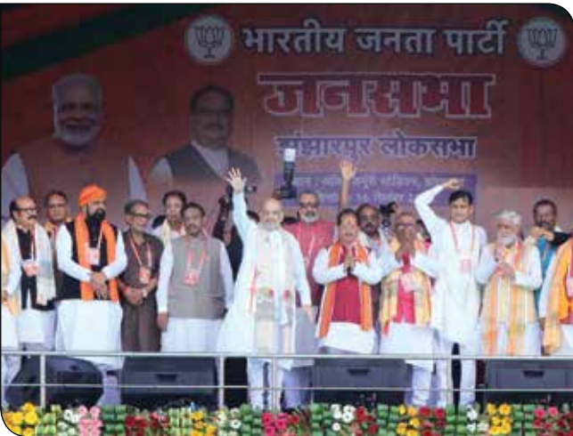
झंझारपुर (बिहार) में 16 सितंबर, 2023 को एक जनसभा में जनाभिवादन स्वीकार करते केंद्रीय गृह एवं सहकारिता मंत्री श्री अमित शाह