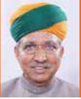
अर्जुन राम मेघवाल

लो कर्तात्रिक व्यवस्था में किसी भी उल्लेखनीय बदलाव के लिए सर्वसम्मति से लिया गया निर्णय विशेष महत्व रखता है। यह समावेशी बदलाव लाने की सामूहिक भावना को दर्शाता है। आज जब भू-राजनीतिक परिदृश्य अनेक संदर्भों में भारी उथल-पुथल का सामना कर रहा है, तब अभी हाल में लोकतंत्र की गौरवमयी जननी भारत के मुकुट में एक और रत्न जुड़ गया है।