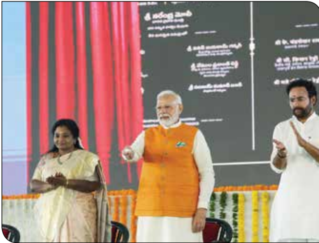
महबूबनगर (तेलंगाना) में 01 अक्टूबर, 2023 को विभिन्न विकासवात्मक परियोजनाओं का शिलान्यास और राष्ट्र को समर्पित करते प्रधानमंत्री श्री नरेन्द्र मोदी