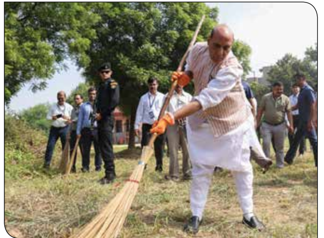
नई दिल्ली में 01 अक्टूबर, 2023 को 'स्वच्छता ही सेवा' अभियान में भाग लेते रक्षा मंत्री श्री राजनाथ सिंह