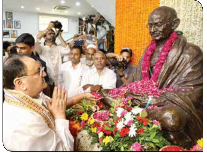
कनॉट प्लेस (नई दिल्ली) में 02 अक्टूबर, 2023 को गांधी जयंती के अवसर पर खादी स्टोर पर महात्मा गांधीजी को पुष्पांजलि अर्पित कर खादी के वस्त्रों की खरीदारी करते भाजपा राष्ट्रीय अध्यक्ष श्री जगत प्रकाश नड्डा