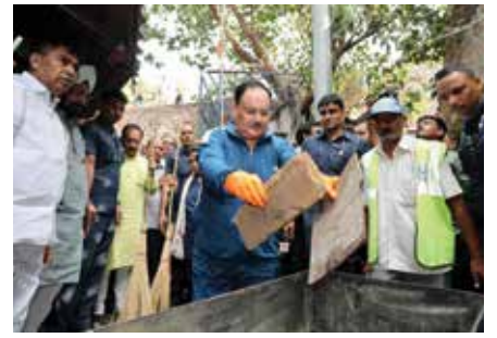
स्वच्छता कार्यक्रम जीवन भर चलनेवाला एक जनांदोलन है