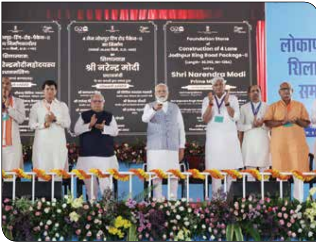
जोधपुर (राजस्थान) में 05 अक्टूबर, 2023 को विभिन्न विकास परियोजनाओं का शिलान्यास और राष्ट्र को समर्पित करते प्रधानमंत्री श्री नरेन्द्र मोदी