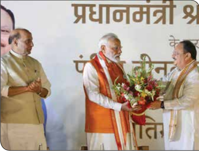
नई दिल्ली में 25 सितंबर, 2023 को पंडित दीनदयाल उपाध्याय की प्रतिमा का अनावरण करने से पहले प्रधानमंत्री श्री नरेन्द्र मोदी का स्वागत करते भाजपा राष्ट्रीय अध्यक्ष श्री जगत प्रकाश नड्डा और रक्षा मंत्री श्री राजनाथ सिंह