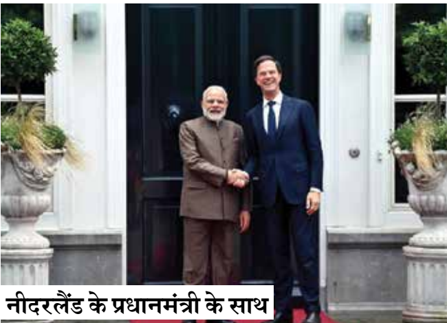
नीदरलैंड के प्रधानमंत्री के साथ