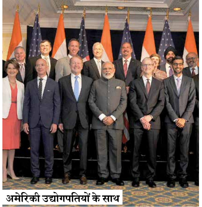
अमेरिकी उद्योगपतियों के साथ