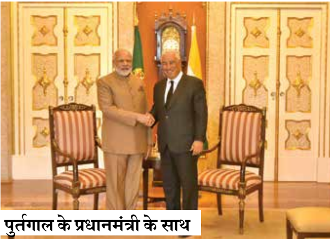
पुर्तगाल के प्रधानमंत्री के साथ