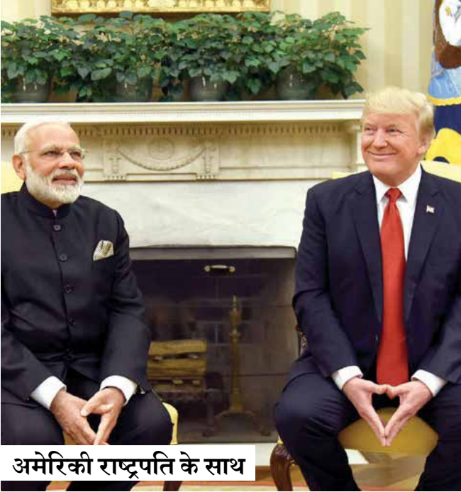
अमेरिकी राष्ट्रपति के साथ