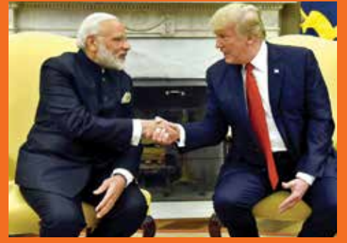
प्रधानमंत्री की पुर्तगाल, अमेरिका और नीदरलैंड की सफल यात्रा

वर्ष-12, अंक-14, 16-31 जुलाई, 2017 (पाक्षिक)