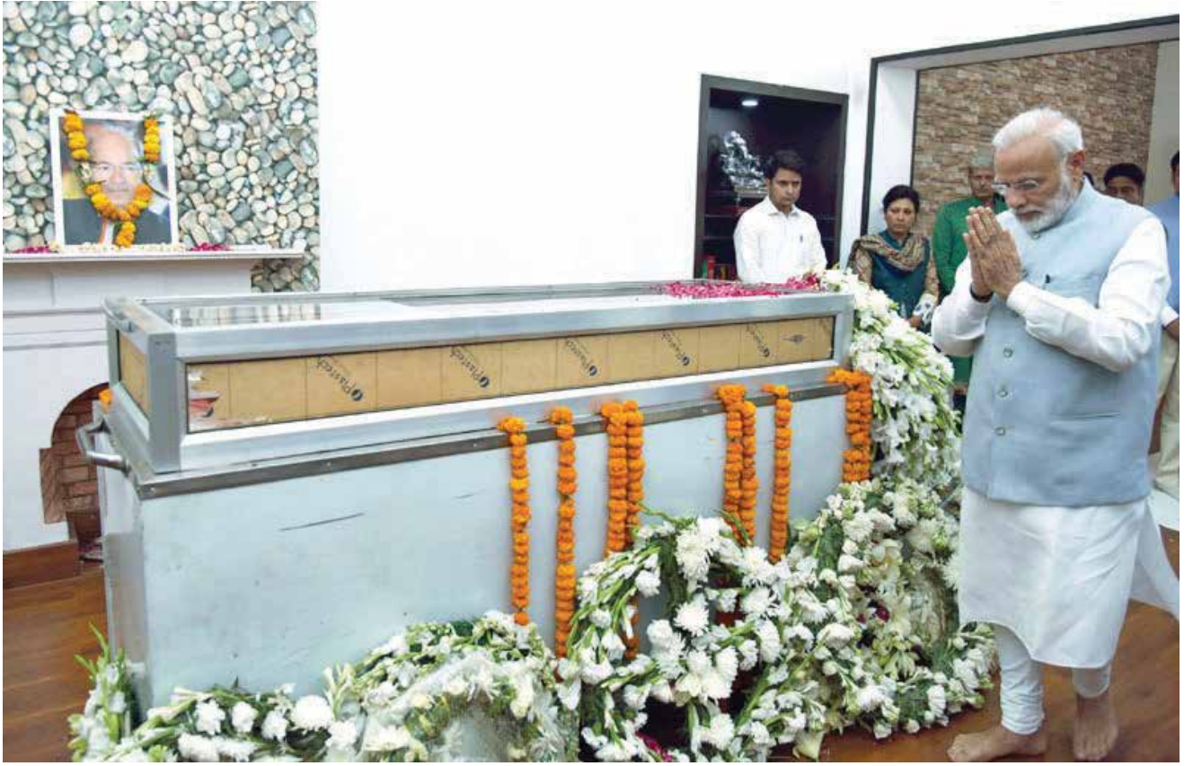
केंद्रीय वन एवं पर्यावरण राज्य मंत्री (स्वतंत्र प्रभार) श्री अनिल माधव दवे को श्रद्धांजलि अर्पित करते हुए प्रधानमंत्री श्री नरेन्द्र मोदी