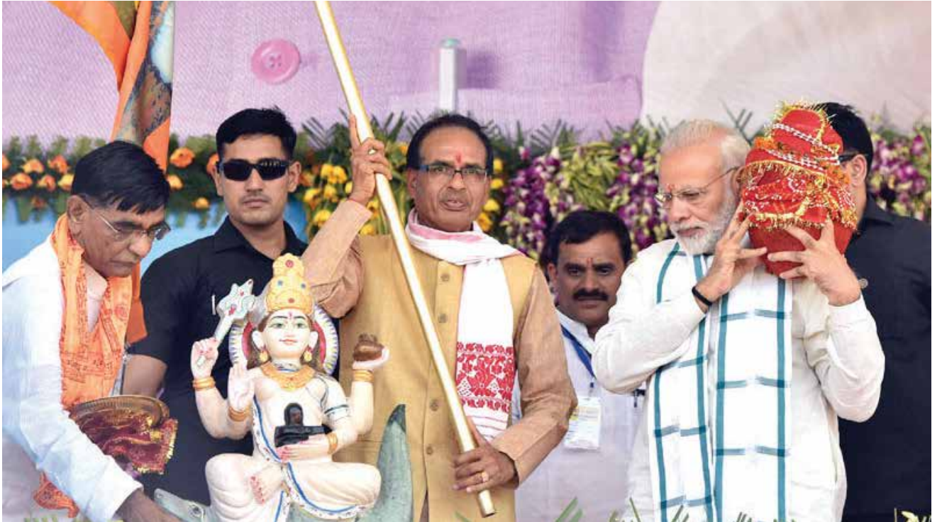
अमरकंटक, मध्य प्रदेश में नर्मदा सेवा मिशन का शुभारंभ और नर्मदा सेवा यात्रा के समापन समारोह पर ध्वज स्थापना और कलश पूजन करते प्रधानमंत्री श्री नरेन्द्र मोदी