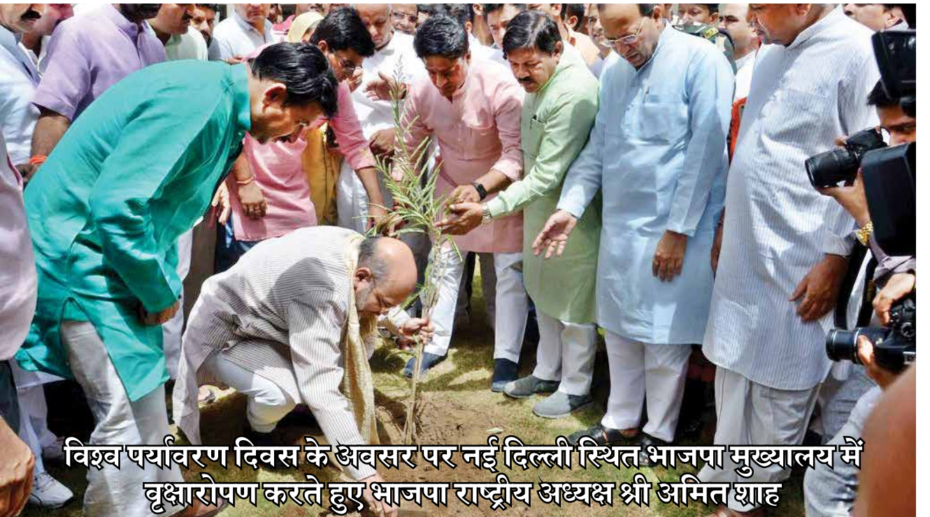
विश्व पर्यावरण दिवस के अवसर पर नई दिल्ली स्थित भाजपा मुख्यालय में वृक्षारोपण करते हुए भाजपा राष्ट्रीय अध्यक्ष श्री अमित शाह