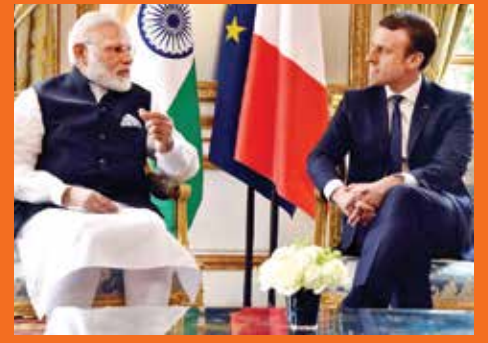
प्रधानमंत्री की जर्मनी, स्पेन, रूस और फ्रांस यात्रा

वर्ष-12, अंक-12, 16-30 जून, 2017 (पाक्षिक)