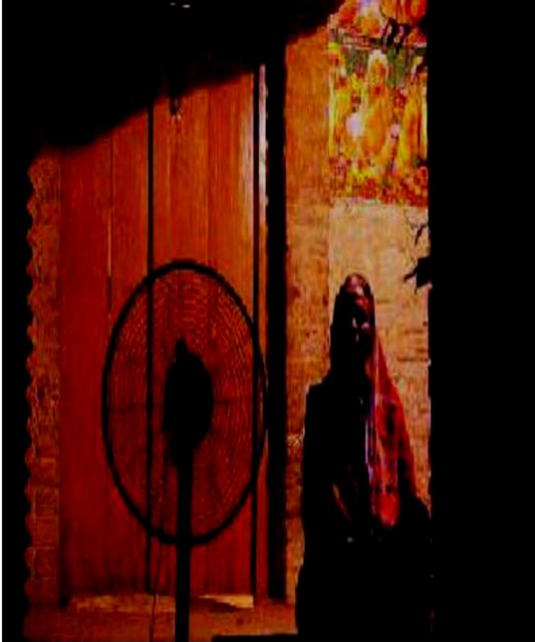
Sheetalkhera in UP becomes one of the 3,000 villages across the country that have been provided electricity only now.